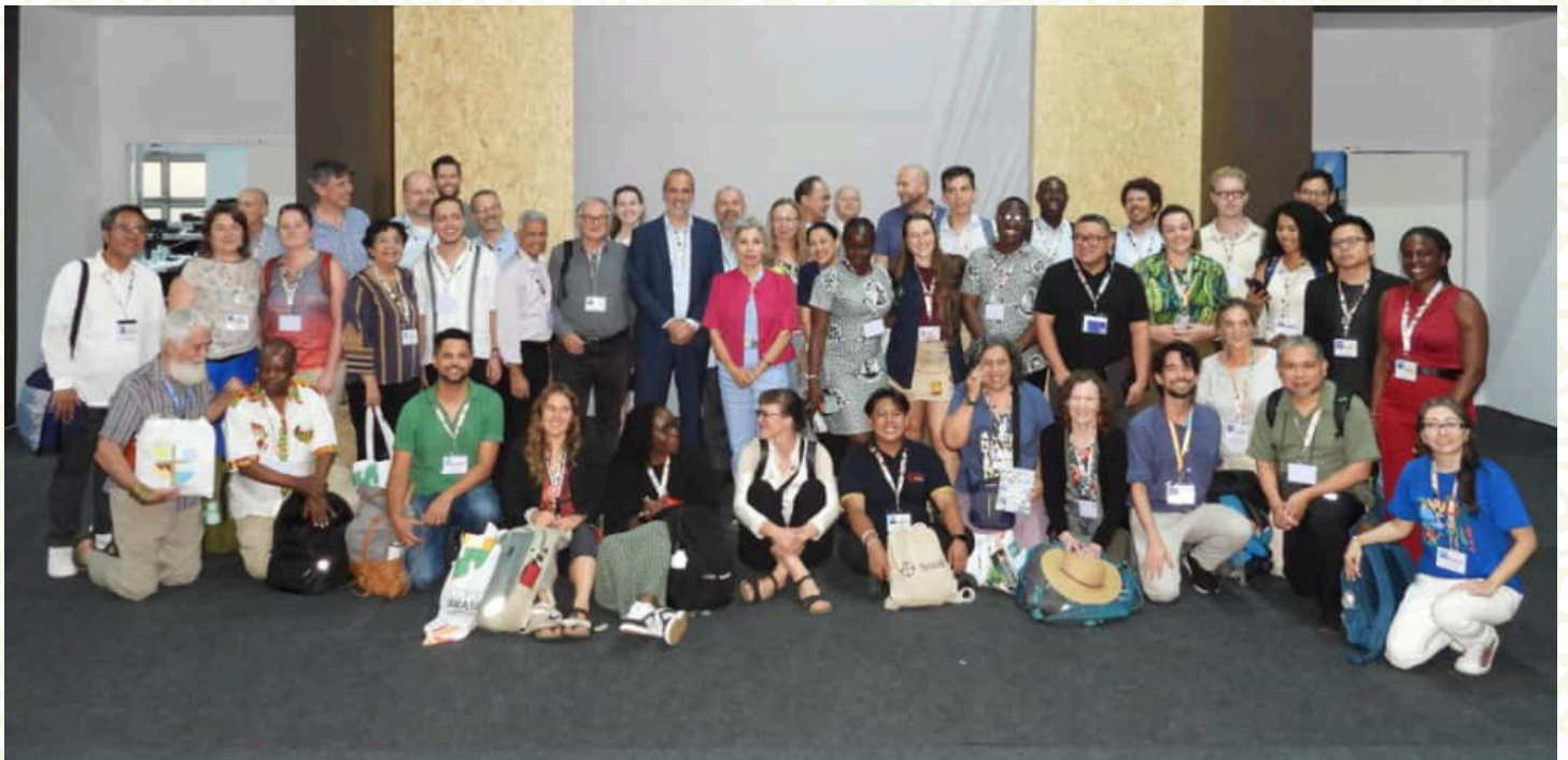
Réunion du NCCEA (Réseau des Acteurs Catholiques pour le Climat et l'Environnement) avec la Délégation du Saint-Siège

Equipe organisadora do evento para o Dia 13 de Novembro de 2025