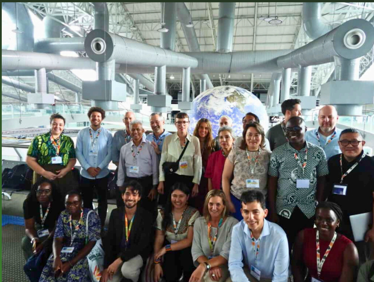
Réunion du Réseau des Acteurs Catholiques pour le Climat et l'Environnement (NCCEA) le 10 novembre

Le Sous-Comité Éducation a été créé au sein du Réseau des Acteurs Catholiques pour le Climat et l'Environnement (NCCEA) à la suite de sa rencontre avec la délégation du Saint-Siège lors du premier jour de la COP30. Le Saint-Siège a invité les organisations catholiques à former des groupes thématiques pour collaborer avec sa délégation au cours des négociations.